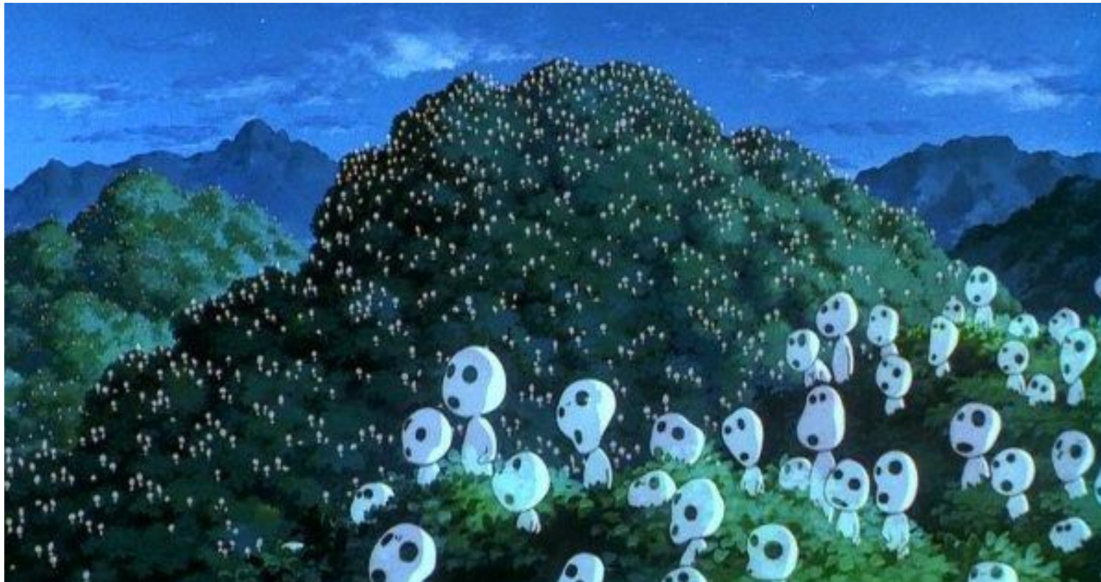
Image extraite du film d'animation Princesse Mononoké , de Hayao Miyazaki