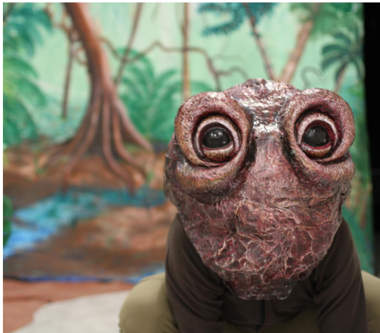
Création d'Alma Roccella en papier mâché Marco le crapaud

L'enseignant·e peut alors déployer leur sensibilité au vivant en étendant le sujet à d'autres activités (écriture, dessin, jeux, visionnage de films animés, courts métrages, analyses ...voir propositions p.8).